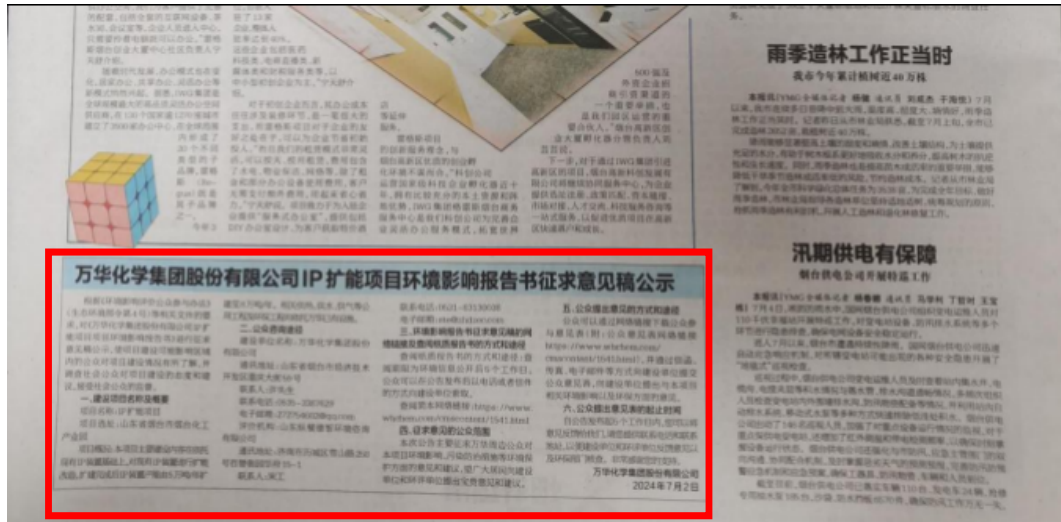
图 2.2-3(b) 本项目环境影响报告书征求意见稿第二次报纸公示（7 月 8 日）