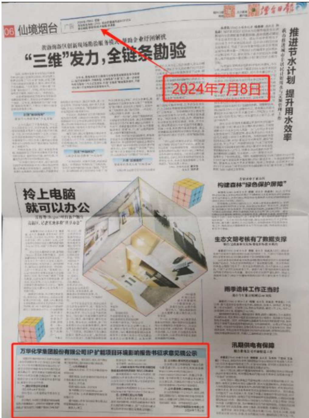
图 2.2-3(a) 本项目环境影响报告书征求意见稿第二次报纸公示（7 月 8 日）