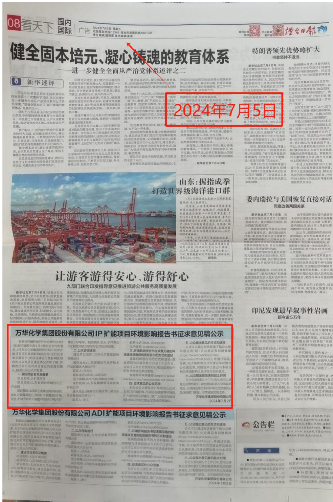
图 2.2-2(a) 本项目环境影响评价报告书征求意见稿第一次报纸公示 (7 月 5 日)